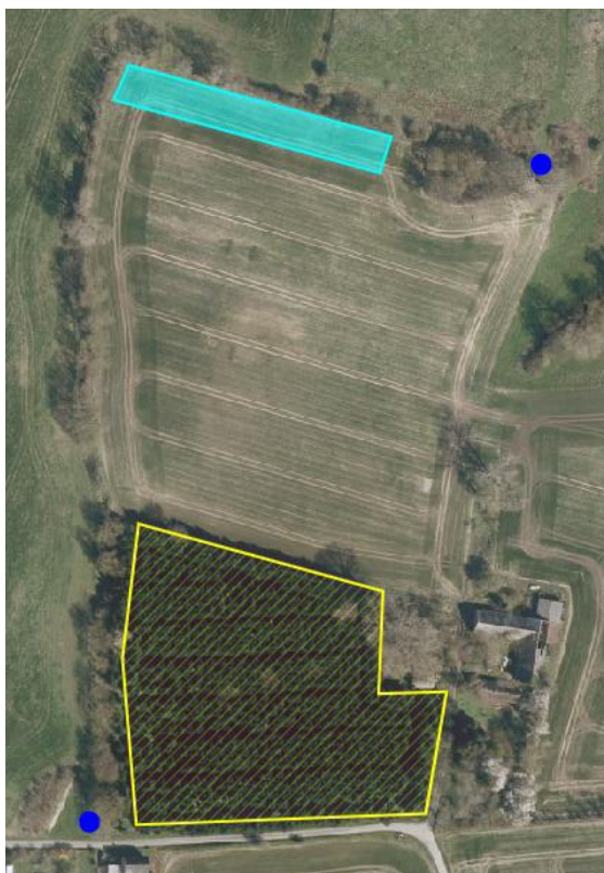
Fig.1: Ønske til placering af boring

Den turkise polygon markerer ønsket placering af boring. De blå prikker er/var drikkevandsboringer. Gul markering er ønsket udledningsområde